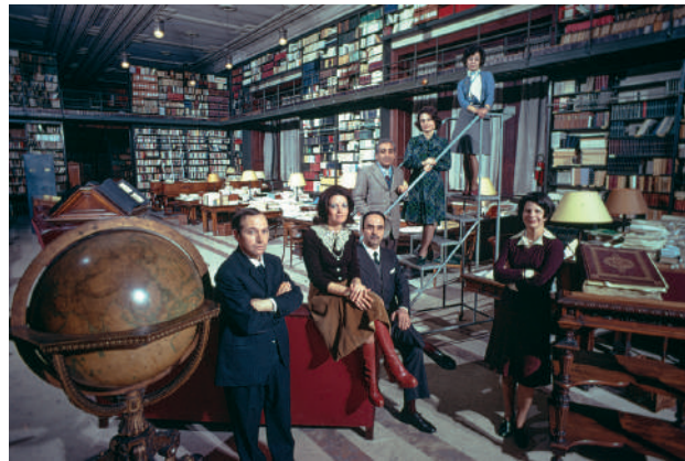
Bibliotecari della Camera nel 1975

Un momento significativo per la collocazione della biblioteca all’interno della Camera è stata nel 1980 l’abolizione del Comitato di vigilanza sulla biblioteca, che dal 1966 aveva sostituito la Commissione per la biblioteca, per far confluire le sue funzioni in una nuova e più ampia struttura, il Comitato di vigilanza sui servizi di documentazione. In questo modo la biblioteca veniva a perdere un significativo elemento di specificità e un importante tramite per far valere le proprie esigenze nei confronti dei vertici della Came-