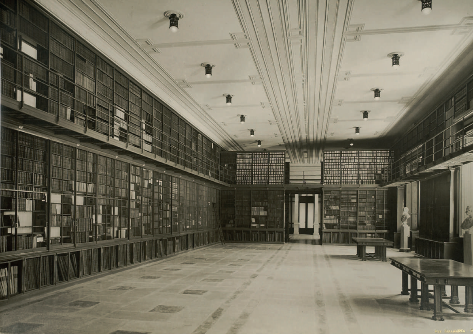
La Biblioteca della Camera nel 1929

Per comprendere il libro di Venturini riteniamo utile analizzarlo secondo sei diversi punti di vista: