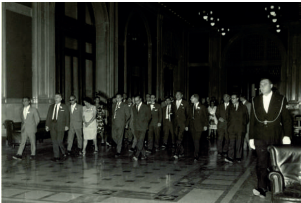
Delegazione IFLA a Montecitorio nel 1964

bra contraddire la “normalizzazione” della collocazione della biblioteca nella struttura, ma nella realtà può essere visto come un primo consolidamento di questo processo, in quanto riconosce sì una specificità della professionalità dei bibliotecari, ma nello stesso tempo colloca definitivamente la biblioteca all’interno dell’organizzazione burocratica della Camera privandola di ogni possibilità di definire almeno per i suoi vertici un rapporto autonomo con l’Aula.